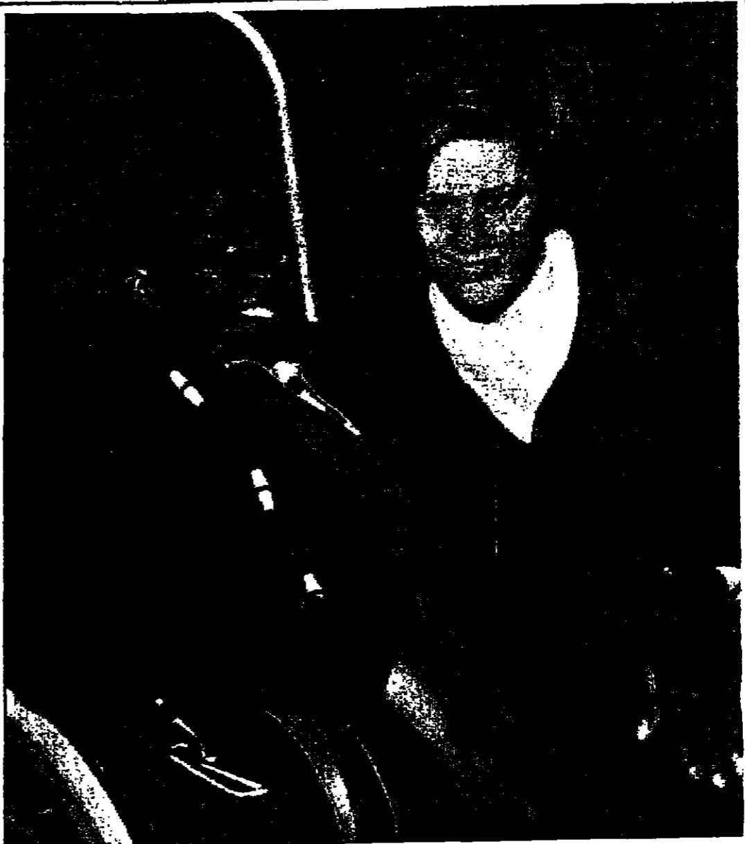
القنصل الاوطني بول كابلان... له خلافا عيناين جراحيتين...

قال إرثر غولديبرغ، مندوب الولايات المتحدة في الأمم المتحدة: إن للامريكانيين الحرية في تبادل آراءهم بحرية.